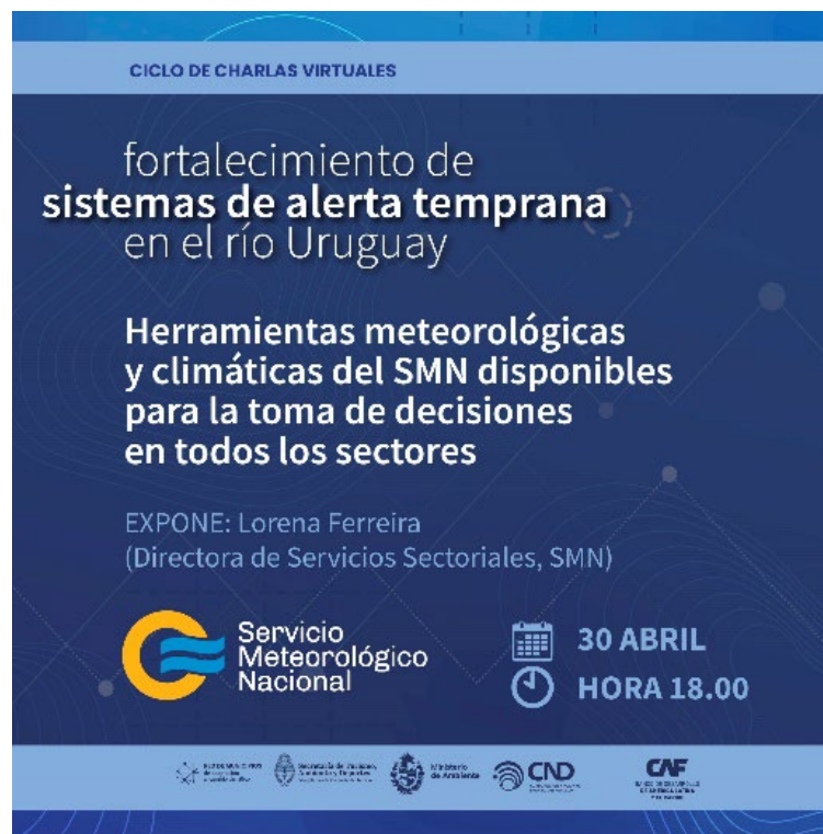
Imagen 3. Difusión de charla con SMN.

Para la charla se inscribieron 85 personas (47 de ellas eran mujeres). La mayoría de las personas inscriptas residían en diferentes ciudades de Entre Ríos pero también de otras provincias de Argentina. También se inscribieron personas de Uruguay y de otros países limítrofes (como Bolivia y Paraguay).