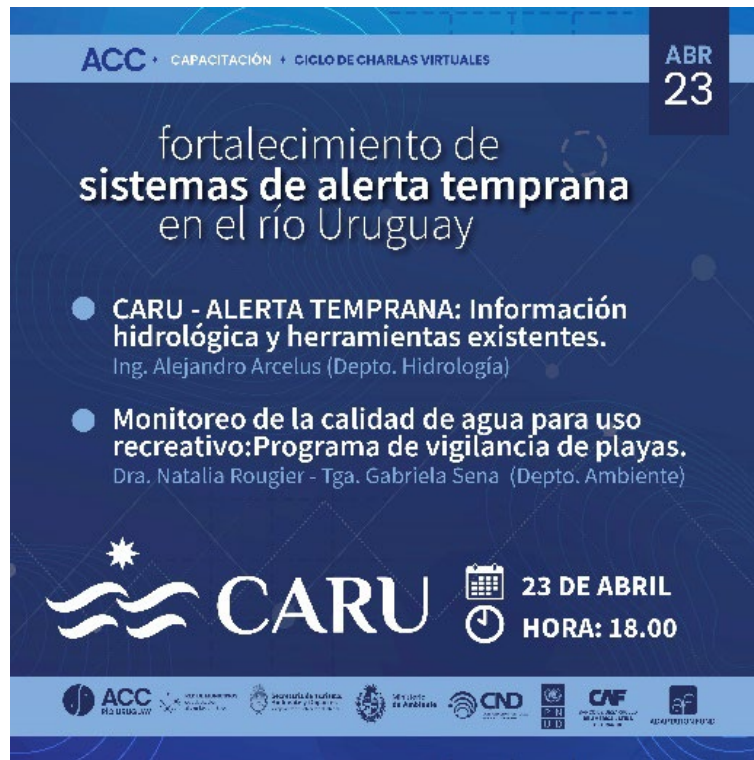
Imagen 2. Difusión de charlas brindadas por CARU.

Presentación (PDF): “Monitoreo de la calidad de agua para uso recreativo: Programa de vigilancia de playas”