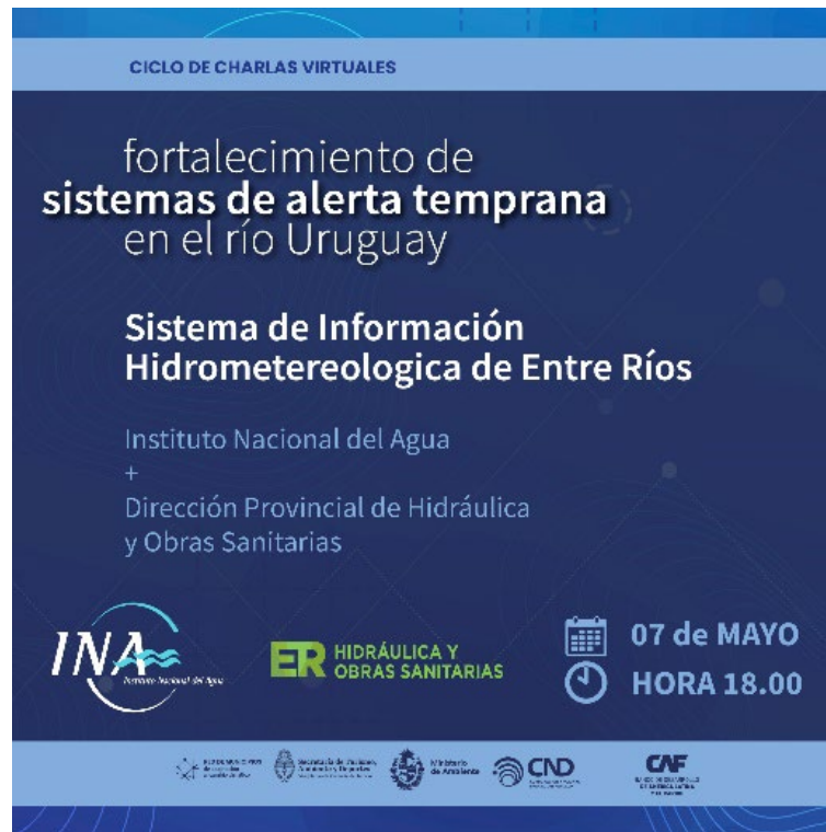
Imagen 4. Difusión de charlas brindadas por INA y DGHyOS (Entre Ríos)

Presentación expuesta (PDF): Sistema de Información Hidrometeorológica de Entre Ríos.