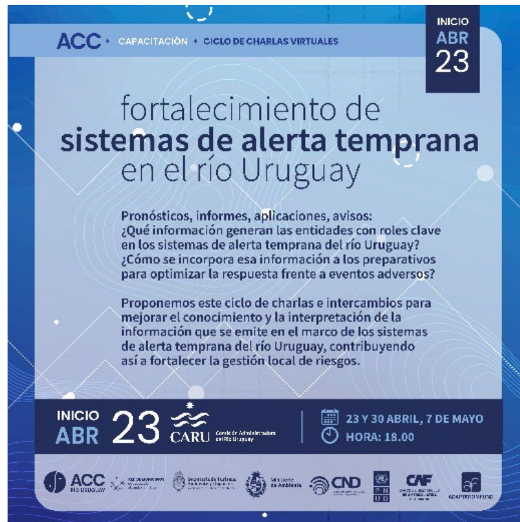
Imagen 1. Placa de difusión de la convocatoria.

La convocatoria de todas y de cada una de las actividades fue realizada desde el proyecto ACC río Uruguay, en el marco de la Red de municipios de adaptación al cambio climático (conformada en localidades costeras de Entre Ríos).